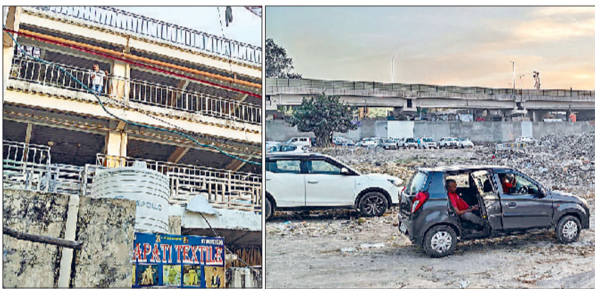
रोहतक। भिवानी स्टैंड पर बनाई गई भट्टरीस्टरी पार्किंग एवं पुराना बस अड्डा के पास गर्वमेंट स्कूल में बनाई गई पार्किंग।

बाजारों में केवल दोपहिया वाहनों को मिलेगी पार्किंग, जल्द लागू होगा नया प्लान