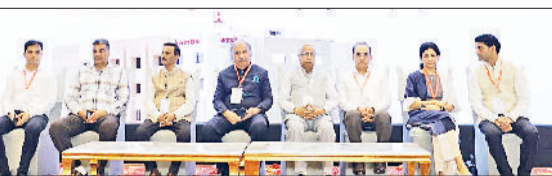
रोबोटिक सर्जरी तक की तकनीकों पर चर्चा की और लाइव सर्जरी के माध्यम से नई तकनीकों का प्रदर्शन किया। इस कॉन्फ़ेस को हरियाणा मेडिकल काउंसिल द्वारा 4 क्रेडिट आवर भी प्रदान किए गए। सम्मेलन में सर गंगा राम अस्पताल दिल्ली, मैक्स अस्पताल, आकाश अस्पताल द्वारका, मेदांता, पीजीआईएमएस रोहताक, बीपीएस खानपुर, एसजीटी और डब्ल्यूएमसी सहित देश के प्रतिष्ठित मेडिकल संस्थानों के विशेषज्ञ डॉक्टरों ने भाग लिया। रोहताक, जींद, दादरी, भिवानी, बहादुरगढ़, हिसार और झज्जर के

हरिभूमि न्यूज रोहताक दिल्ली रोड स्थित कॉणोस अस्पताल में हर्निया सर्जरी पर एक ऐतिहासिक मेडिकल कॉन्फ़ेस का आयोजन किया गया। एंजोसिएशन ऑफ सर्जन्स ऑफ इंडिया हरियाणा चैप्टर के सहयोग से आयोजित इस कॉन्फ़ेस में पहली बार रोहताक में रोबोटिक तकनीक से हर्निया सर्जरी का लाइव प्रदर्शन किया गया। इस आयोजन ने क्षेत्र में आधुनिक और हाईटेक चिकित्सा सुविधाओं की दिशा में एक नई मिसाल कायम की। इस सम्मेलन में हरियाणा, दिल्ली और उत्तर प्रदेश से आए 200 से अधिक वरिष्ठ डॉक्टर, सर्जन, मेडिकल फ़ैकल्टी और मेडिकल छात्र शामिल हुए। विशेषज्ञ डॉक्टरों ने हर्निया के इलाज की पारंपरिक ओपन सर्जरी से लेकर अत्याधुनिक