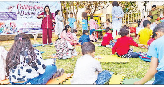
ड्रॉइंग और कैलीग्राफी प्रतियोगिता में बच्चों ने दिखाई रचनात्मकता